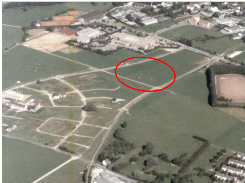
Luftbildausschnitt vom Bereich der alten Fluren Branderfeld und Bobenden, Lage des heutigen Lontzenweges (Markierung)