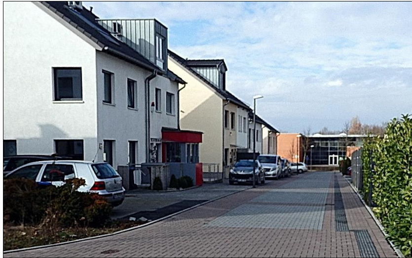
Südwestliche Zufahrt mit Blick auf die Schagenstraße (im Hintergrund die Grundschule Brander Feld)