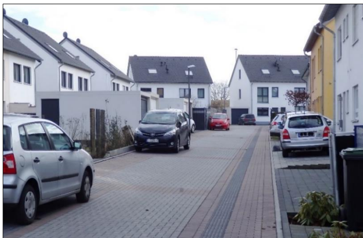
Nord-östliche Zufahrt in den Lontzenweg, Blick von der Schagenstraße