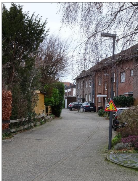
Blick von der Albert- Schweitzer-Straße in den Kitzenpfad