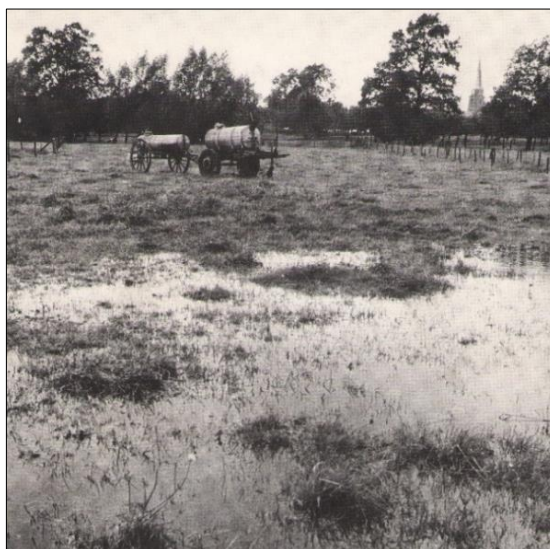
Im Kollenbruch in den 1960er Jahren