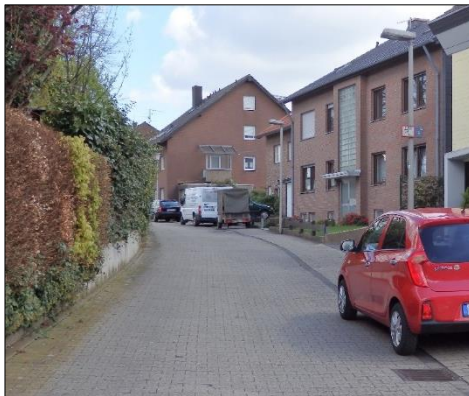
(Oben) Blick von der Albert- Schweitzer-Straße in den Weg Im Krähenfeld