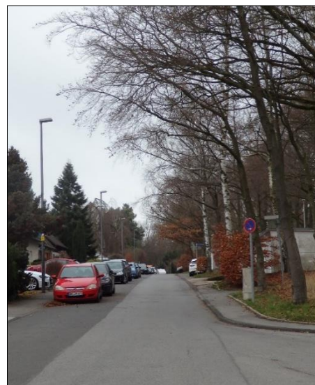
Blick vom Wendeplatz nach Norden in Richtung Birkenstraße