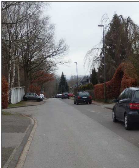
Blick in südliche Richtung zum Wendeplatz