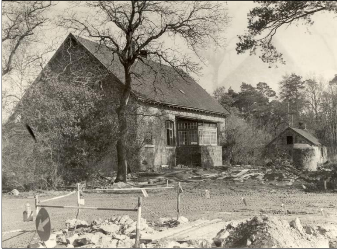
Ehemaliges Forsthaus der Gemeinde Brand an der Birkenstraße im Ortsteil Freund – Waldsiedlung; der Abriss er- folgte im Jahr 1964