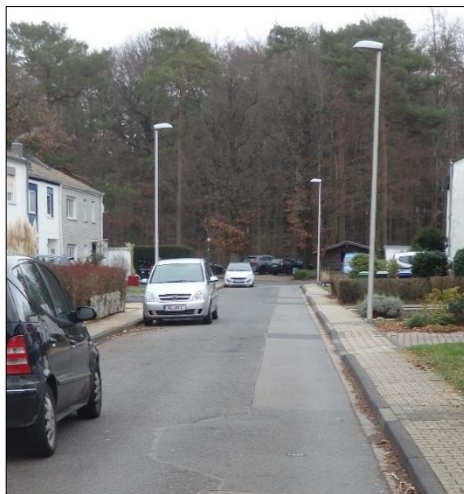
Ansicht von der Kreuzung Buchenheck/Am Forsthaus auf den Zugang zum Brander Wald