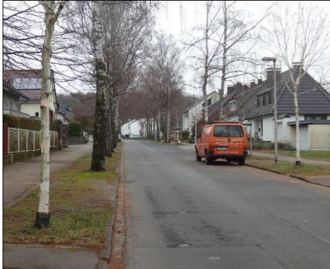
Blick in die Birkenstraße in Richtung Brander Wald