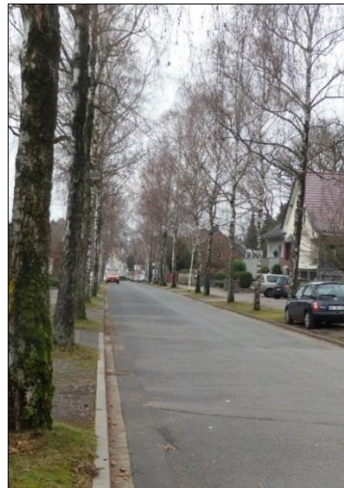
Blick in die Birkenstraße (Bereich zwischen Kreuzung Buchenheck/Am Forsthaus)