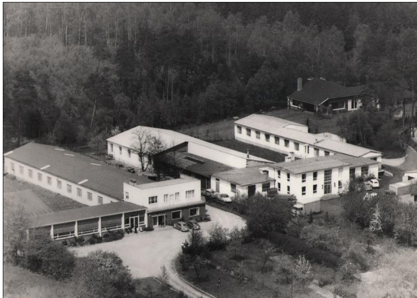
Foto der ehemaligen Textilfabrik Batholemy in Freund an der Birkenstraße